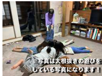
※写真は大根抜き遊びをしている写真になります!!

「イモムシゴロゴロ」は全員横1列に寝っ転がり、「イモムシごーろごろ」と言いながらみんな横にゴロゴロ転がる、次に「あっちの方へごーろごろ」と反対の方に転がって戻る、そして「それっ!」と言って中央の直径2メートルくらいの円の中に集まって「おしくらまんじゅう押されて泣くな」をして勝負をする、というゲームで押し出されず最後に残った1人が勝ち。