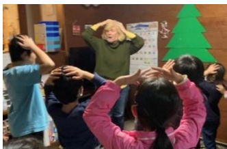
ジェニーと遊ぼう(左) ♪ヘッド&ショルダー ニーズ & トウズ ニーズ&トウズ・・・♪

11月はそれぞれの時間を見ながらクリスマス作品に取り組みました。基本的に1年生はマカロニリース、2年以上はタイルにクリスマスにちなんだ絵を貼ってデコパージュかフェルトのパッチワークをしました。マカロニを段ボールの台紙にボンドで貼り付け、固まったらメタリックスプレーをかけて出来上がりです。よく目を凝らしてみると、それぞれにマカロニの置き方に個性が出て、「あー○○ちゃんっぽい」「○○くんらしい！」とスタッフたちは思いました。