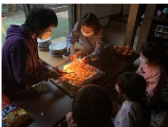
(左) 10月誕生会 バースデーケーキ