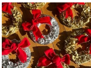
(右) マカロニリース